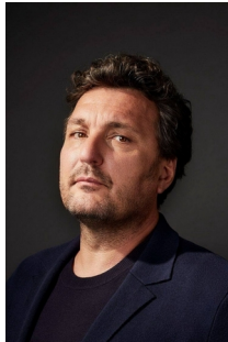
Don Carlo di Vargas, il fratello (baritono) Ludovic Tézier (1)